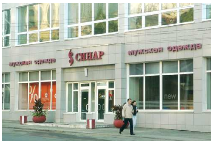
Киножурнал «Сибирь на экране» хроника открытие фирменного магазина